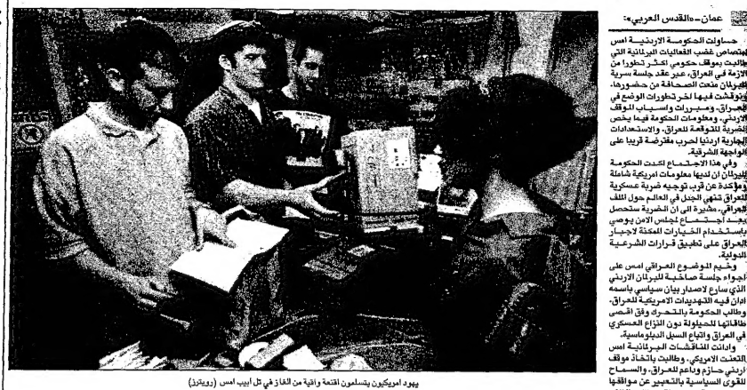
يؤيد الكويتيون بسلوكهم المعتاد وثمة من الغاز في تل أبيب، ام (بنيان)